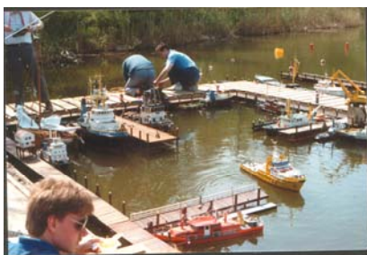
1e Open dag vanuit eigen clubhuis

Op 26 april 2003 vierden de leden het 20-jarig bestaan van VAARGROEP Flevoland, tijdens een feestelijke bowlingavond.