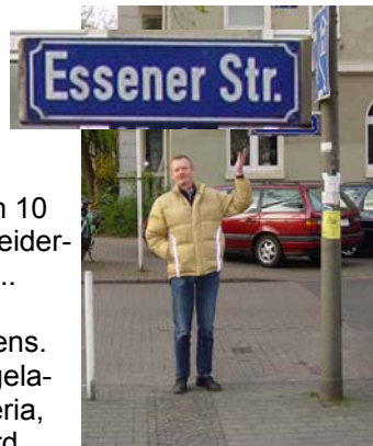
Ook bekend in Dortmund

Na een uitstekende maaltijd, in het gezelschap van (jawel) Vaargroep Harderwijk en 4 mensen