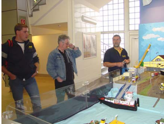
Aandacht voor een verzorgde stand

werd besloten tot de aankoop bestaande uit een F14, een Multi-schwitch/prop-module, een zender-accu en een regelaar. De schade kon gelukkig gefinancierd worden uit de opbrengst van drie dagen "beunen in uniform". Vervolgens werd de zwik in de auto gemikt (stond toch vlakbij) en verder ging het met een uitgebreidere verkenning van de complete beurs.