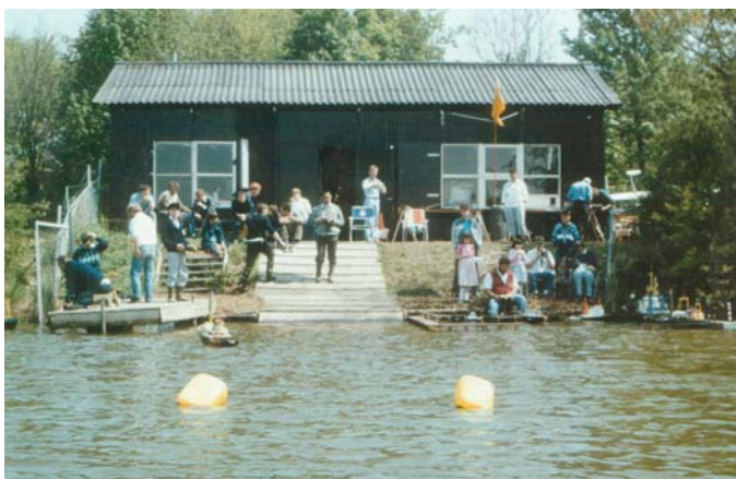
Open dag vanuit IJsclubhuis

Na een aantal omzwervingen vond het bestuur van de Vaargroep onderdak in het clubhuis van de IJsbaanvereniging te Biddinghuizen, onze huidige burens.