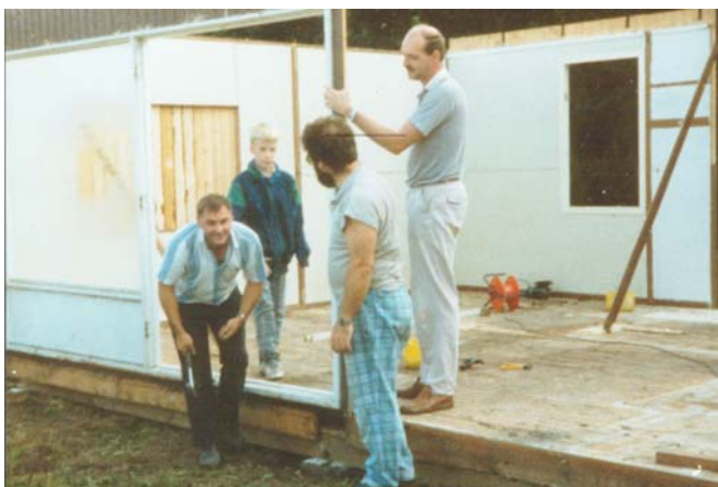
Het herbouwde zomerhuisje als eerste clubgebouw

Op zaterdag 12 september 1992 werd begonnen een nieuwe berging naast het clubhuis in elkaar te zetten.