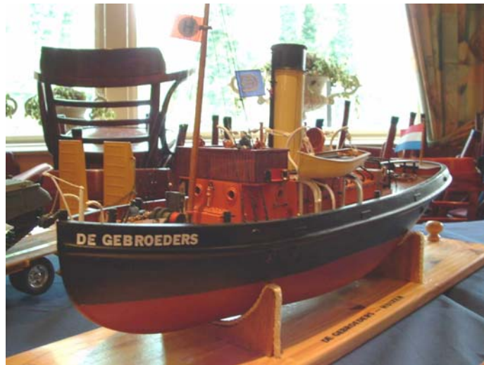
Sleepboot "De Gebroeders"

De begroeting van de voorzitter van Epe viel ook tegen. Hij hield ons voor dat we ons niet aangemeld hadden, waardoor er waarschijnlijk geen plek voor ons was.