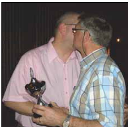
Dus, ..... Zoenuh! Zoenuh, Zoenuh !!!