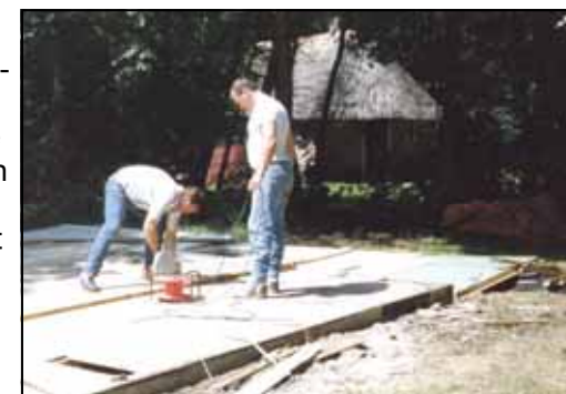
Demontage van zomerhuisje in Doornspijk

Met de nodige creativiteit is dat gelukt en zo werd Vaargroep Flevoland de trotse eigenaar van een eigen clubonderkomen.