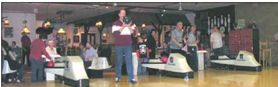
Bowlingavond op 9 april 2005 bij Trim/Inn te Dronten

Het is bijna een gewoonte geworden om voor de leden en de familie in het voorjaar een bowlingavond, en in het najaar een barbecue te organiseren.