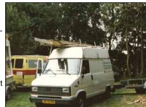
Transport van zomerhuisje met auto van de baas

Eind jaren negentig werd men het vele onderhoud aan dit clubhuis beu en er kwam op een ledenvergadering een voorstel op tafel het te vernieuwen