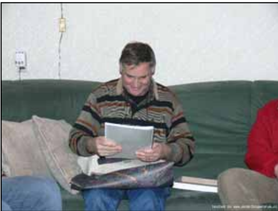
Kijk ..... een boekje, wat leuk!