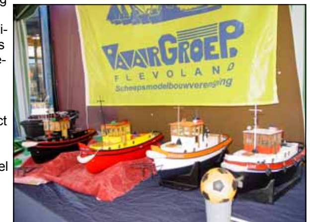
De balbootjes uitgesteld op een evenement