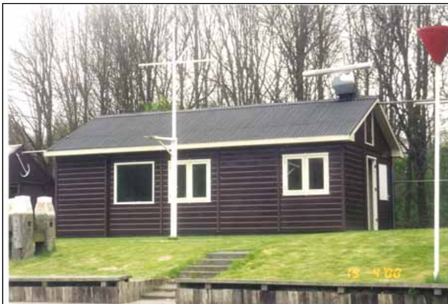
Het vernieuwde clubhuis anno 2000