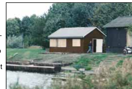
Het omgebouwde zomerhuisje tot clubgebouw