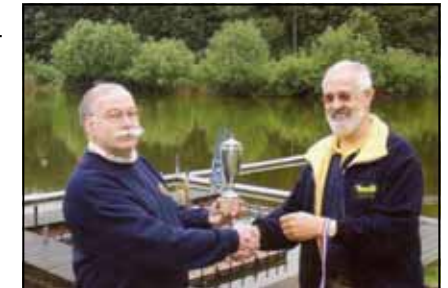
Ontvangst van de Taconisprijs