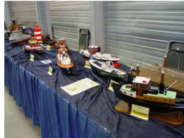
De modellen konden ruim en overzichtelijk worden opgesteld

Eerst de kleden eraan en erop, één tafel weg gehaald en als koffietafel er achter gezet. Toen de Enterprise op tafel en de Stefan Jan H, daarna het binnenvaartschip. Zo, daarmee was inmiddels al zes meter gevuld.