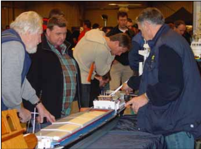
Het binnenvaartschip op de stand, waarvan enkele bezoekende dames ontdekten dat de constructie van de luiken niet klopte