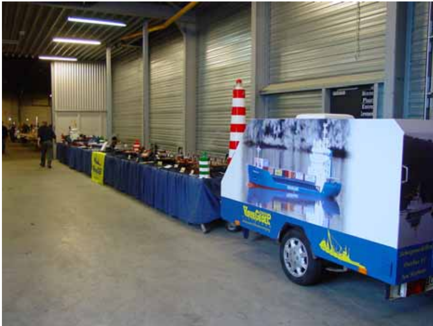
De gehele wand van de gang tussen de hallen werd door VGF waardig opgevuld

Hij bracht ons naar onze plek, en daar stonden me toch een rij tafels. 16 meter totaal en dat moest toch wel een beetje vol komen te staan.