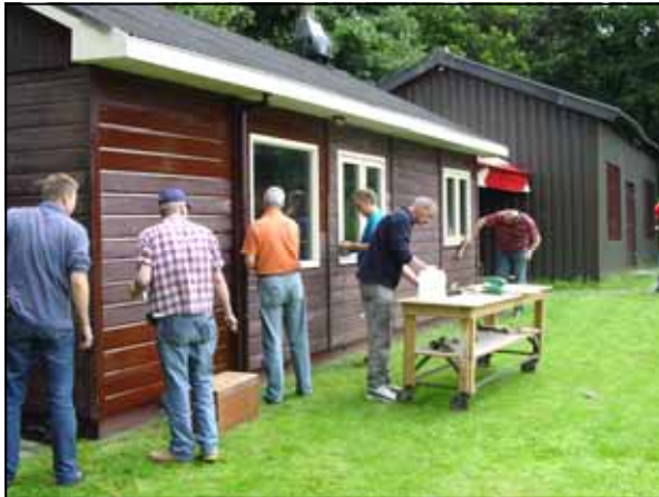
In 2007 had het clubhuis weer een verfje nodig

Voor het plaatsen van steigers, golfbrekers en boeien in het voorjaar en het weghalen ervan in het najaar geldt eveneens de slogan 'Veel handen maken licht werk'.