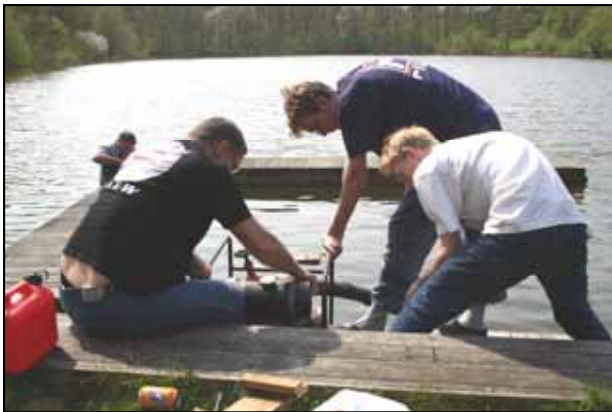
Alle kracht is nodig voor het aanslaan van de waterpomp om de buizen van de steigers in de grond te kunnen spuiten