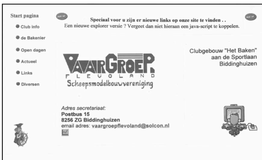
Hoofdpagina van de website van Vaargroep FLEVOLAND

Internet is dus voor onze vereniging een zinvol medium.