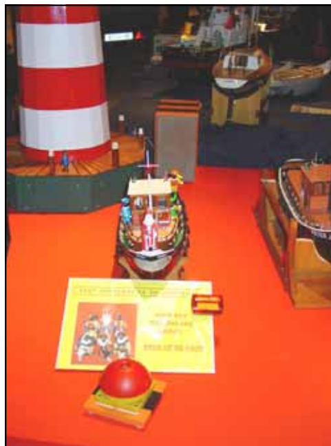
....met een druk op de knop