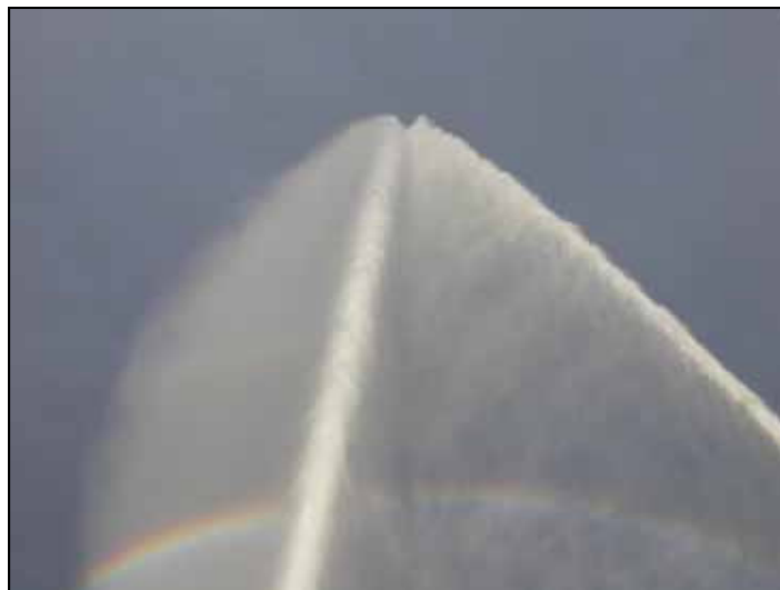
Een veertig meter hoge waterzuil

In Vlaardingen halen we wat Chinees en eten in de ruime kombuis. De communicatiemiddelen staan even op stand by. Na de avondmaaltijd en de afwas worden de trossen weer losgegooid en varen we de Nieuwe Maas weer op. Tijd om even proef te draaien met alle blusmonitoren. Een computerscherm laat alle relevante informatie over het blussysteem zien en met joysticks worden de monitors gericht. Even later barst er een zeer plaatselijke regenbui van 30.000 liter water per minuut los. Willem moet gas bijgeven om de '12' op haar plaats te houden als de monitors naar voren spuiten.