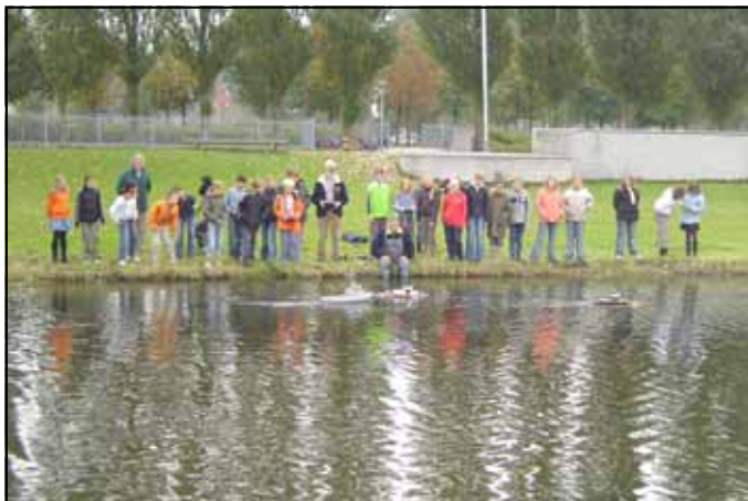
De leerlingen mochten met de balbootjes varen