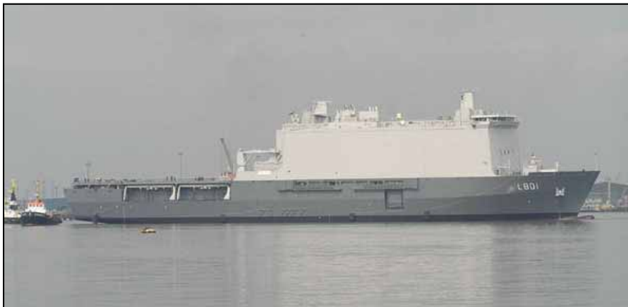
L 801 Landing Platform Dock JOHAN DE WITT

De L 801 (zoals de kenletters op de boeg aangeven) krijgt een multifunctionele rol. Het kan ingezet worden voor transport, voor amfibische operaties, als commandoplatform, als gewondenopvang en ziekenhuis, maar de voornaamste taak is toch het ondersteunen van amfibische operaties. Dit betekent het transporteren en het voor de kust kunnen ontschepen (debarkeren) van een mariniersbataljon (ca. 610 manschappen), inclusief ondersteunende voorraden.