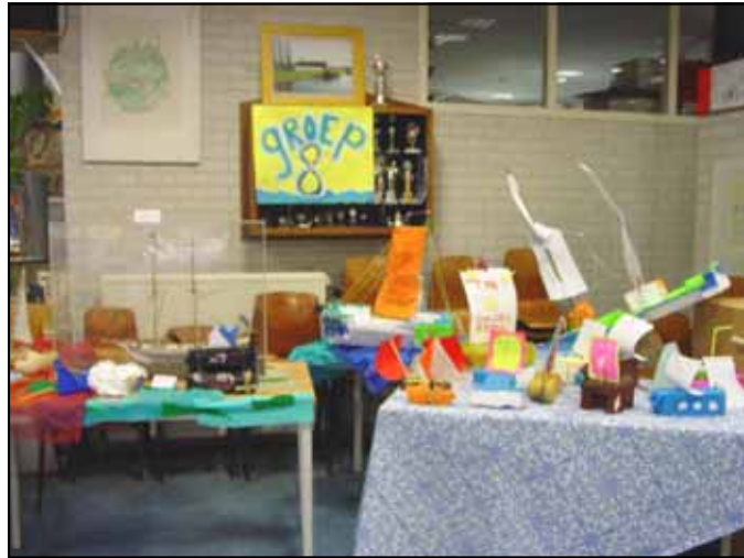
De bouwsels van groep 8 tentoongesteld

We besloten onze modellen in de school achter te laten en de volgende avond aanwezig te zijn op de kijkavond.