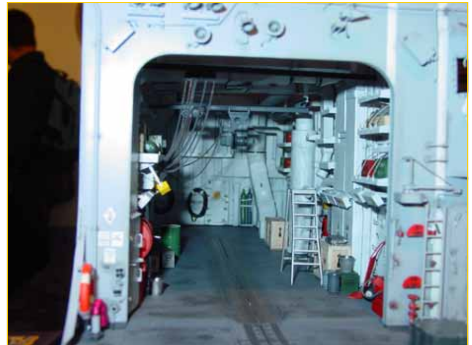
Details binnen in een model van een Duits fregat!!