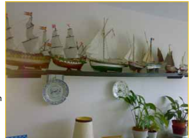
De modellen op planken in de woonkamer

Daar namen we afscheid van elkaar en wensten hem veel sterkte.