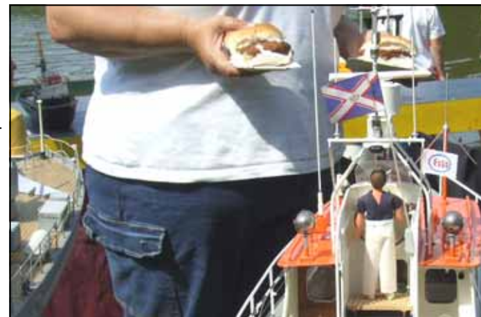
De gehaktballen vonden gretig aftrek

Een ieder kon terug zien op een meer dan een geslaagde dag.