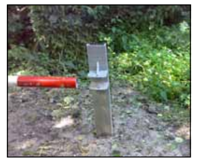
in geopende stand

Deze paal was destijds een paar decimeter verder vanaf het draaipunt geplaatst. Een aantal uren later hadden de werklieden de paal met betonkluit inmiddels uitgegraven en op de juiste plek geplaatst, en zo kon onze penningmeester, zonder kosten consequenties, met een gerust hart de draaiboom weer sluiten..