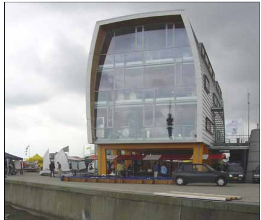
Half beschut onder het havenkantoor stonden de modelboten opgesteld

We hadden toen precies genoeg ruimte om de bak strak tegen de gear-