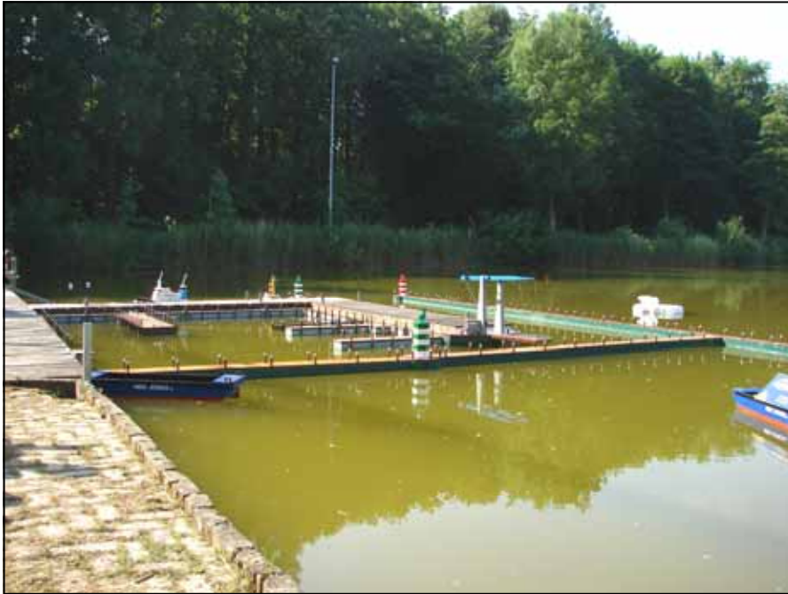
De opgeknapte haven met verlichte bakens

De boeien werden vernieuwd en aangepast. De loopsteiger al voor een deel van nieuwe planken voorzien. En de gehele voorwand van de schuur gemodificeerd en vernieuwd.