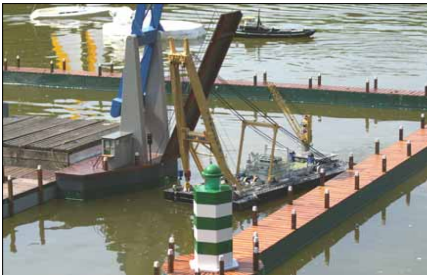
De Taklift 4 manoeuvreert langs de geopende brug

Met een niet al te lange toespraak van onze voorzitter werd het startsein gegeven en er kon de gehele dag gevaren worden in blokken van 20 minuten, zodat een ieder in de gelegenheid was om de modellen op het water te demonstreren.