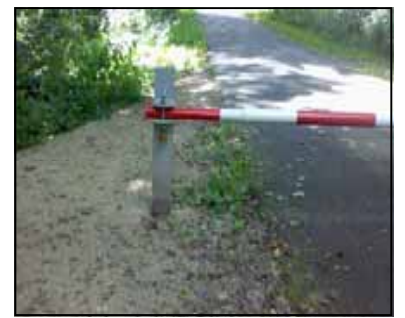
in gesloten stand

Er hadden mensen bij de Gemeente geklaagd dat dat gevaarlijk was voor passerende fietsers.