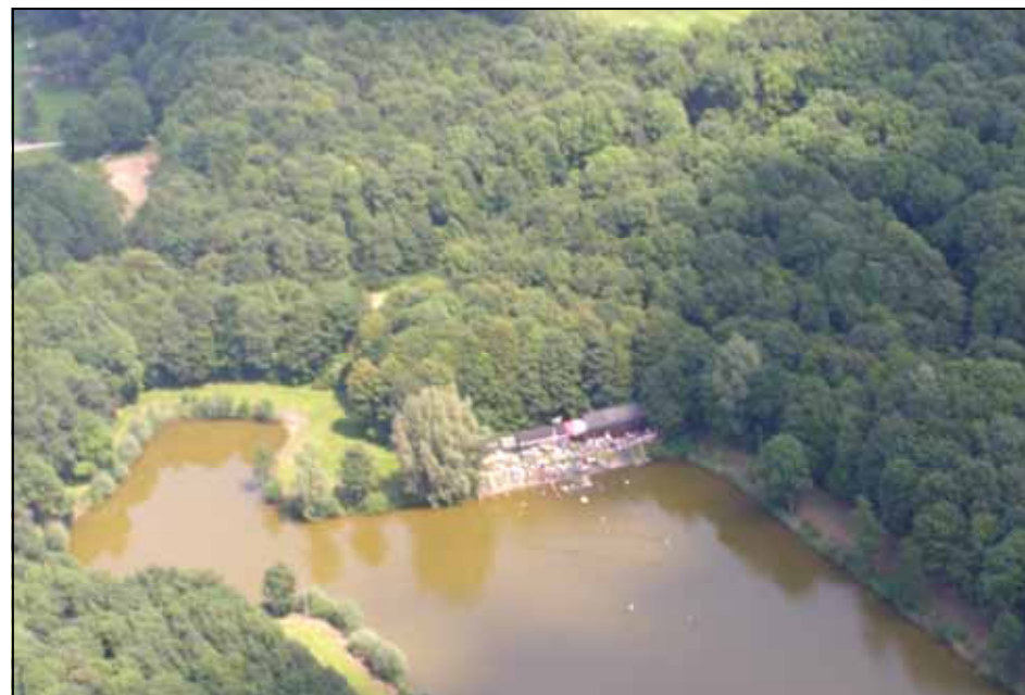
Een luchtfoto geeft de drukte weer

Op alle vragen kregen we in de loop van dag antwoord. Bijna alle aangemelde bezoekers kwamen en het werd heel erg druk.