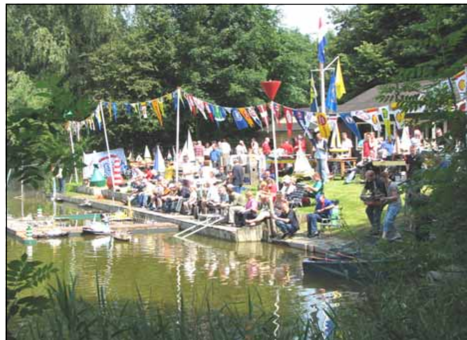
Opendag 2007 in een gezellige en gemoedelijke sfeer