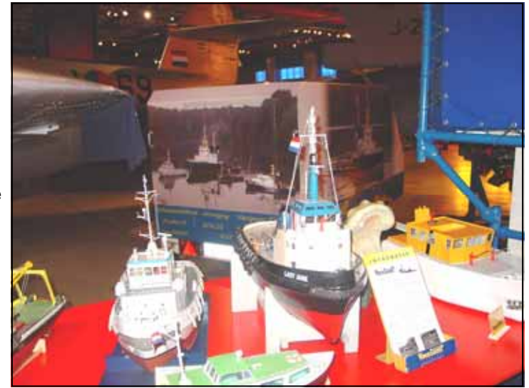
De aanhanger als blikvanger achter de stand

Elke dag hadden we een bezetting van ca. drie mensen, met als hoogtepunt beide zondagen toen er resp. acht en negen VGF-ers in het museum waren te vinden.