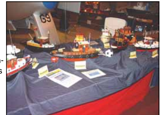
13 balbootjes bij elkaar

Het semi balbootje 'Willem' van Norwin fungeerde als Sinterklaasboot met de Sint en Piet figuurtjes van Ton er bovenop. Via de geluidsknop van Jaco konden kinderen daarbij met een druk op de knop 30 seconden naar een sinterklaasliedje luisteren en zich ondertussen vergapen aan