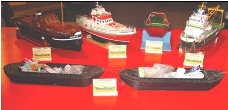
Het publiek wist waar de bakken van de Reinigingsdienst voor waren ...

Vrijdagmorgen misten we bij binnenkomst twee van de vier bakken. Denkend aan een grap kamden we de ruimten onder de tafels, en de kisten uit, echter zonder resultaat.