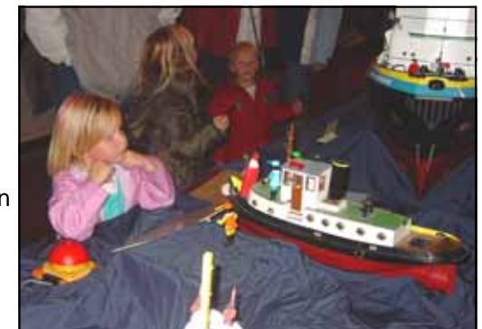
Vergapen aan Sinterklaas en de Pieten