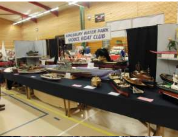
Foto-impressie van Egberts bezoek aan een modelbouwbeurs te Engeland.