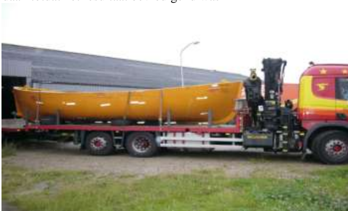
The real thing

Aan de slag dus. De spanten van hout gemaakt en de romp gemaakt van polyester. Valt ook niet mee als je dat nog niet eerder hebt gedaan. Ook hier verschillende pogingen gedaan totdat het resultaat bevredigend was